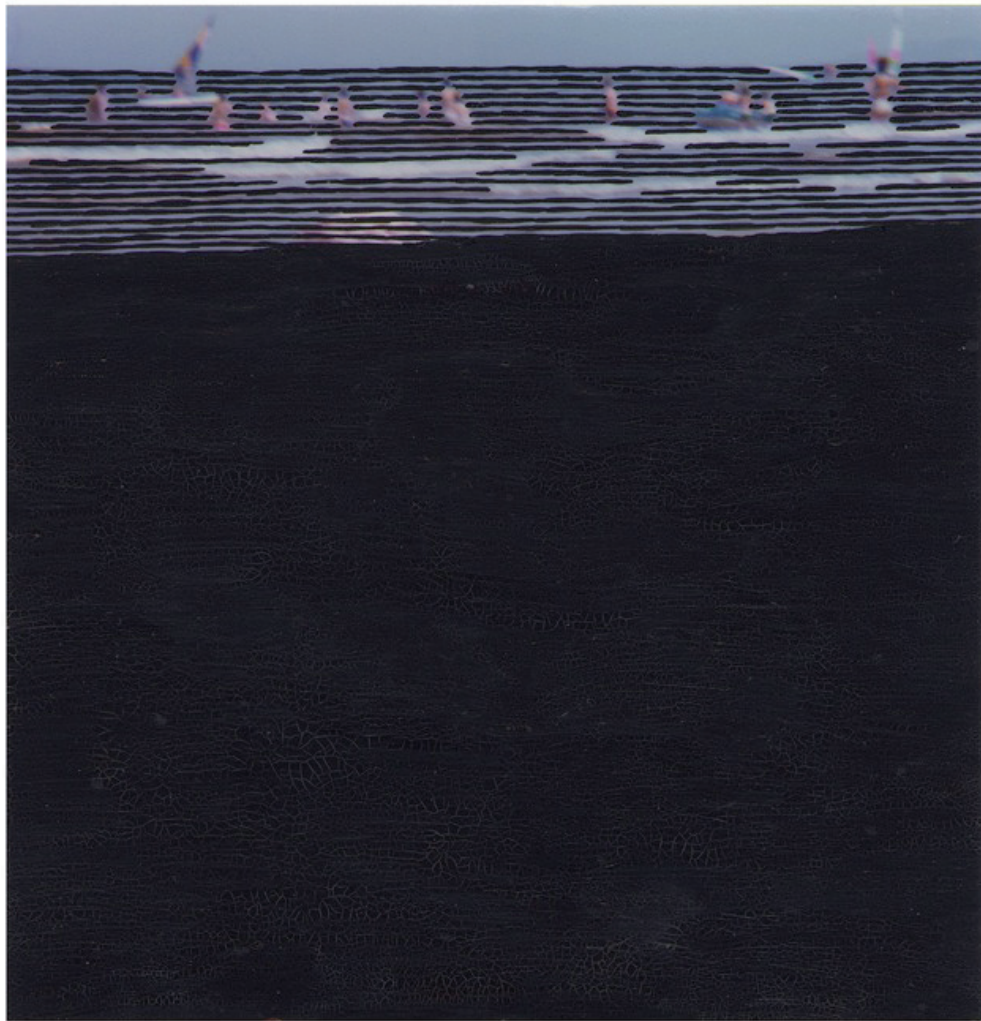
Jochen Gerner Hyères hier 6, 2015 encre de chine sur photographie argentique (1982) 8,5 x 8,9 cm