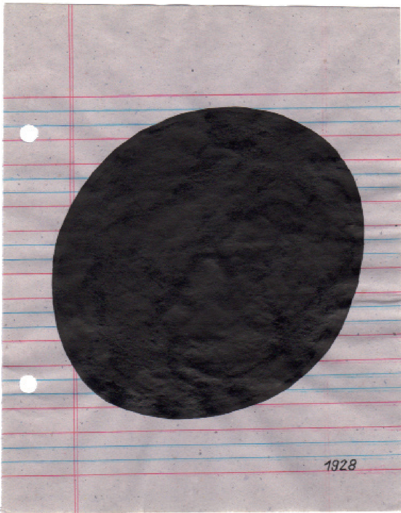
Jochen Gerner 02, 2016 série A history of America encre de chine sur papier 12,8 x 16 cm