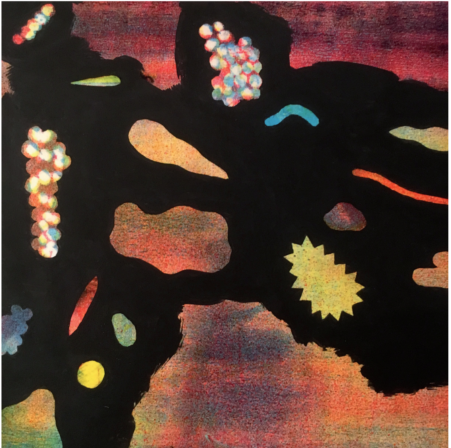
Jochen Gerner Détail de Lac Noir , 2016 43,1 x 59,5 cm