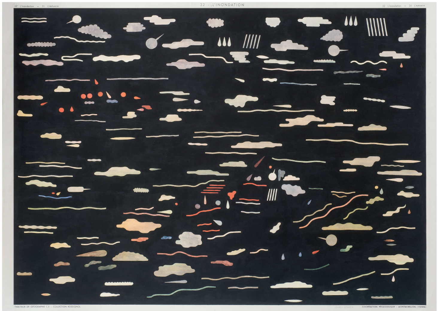
Jochen Gerner L'inondation , 2016 acrylique sur support imprimé 56 x 75,8 cm